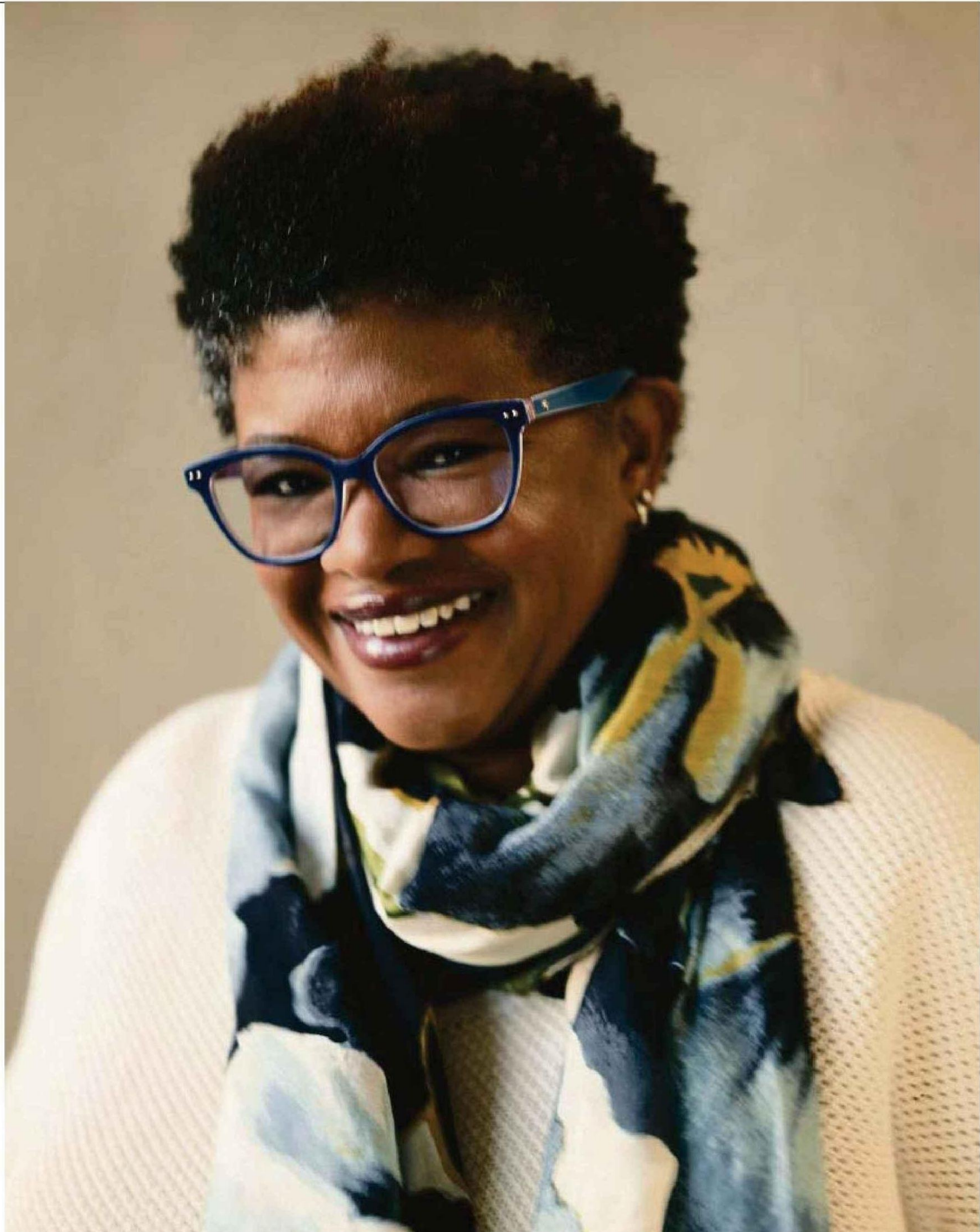
Attica Locke mercredi à Paris.