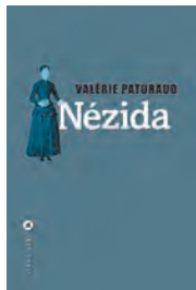
Nézida Valérie Paturaud 181 pages, 17€ aux Editions Liana Levi