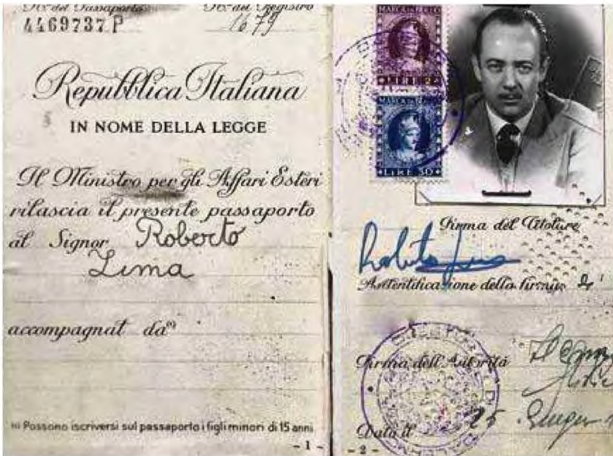
L'un des faux passeport de Raimondo Lanza di Trabia. RAIMONDA LANZA DI TRABIA