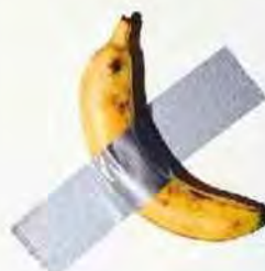
« Comedian », de Maurizio Cattelan.