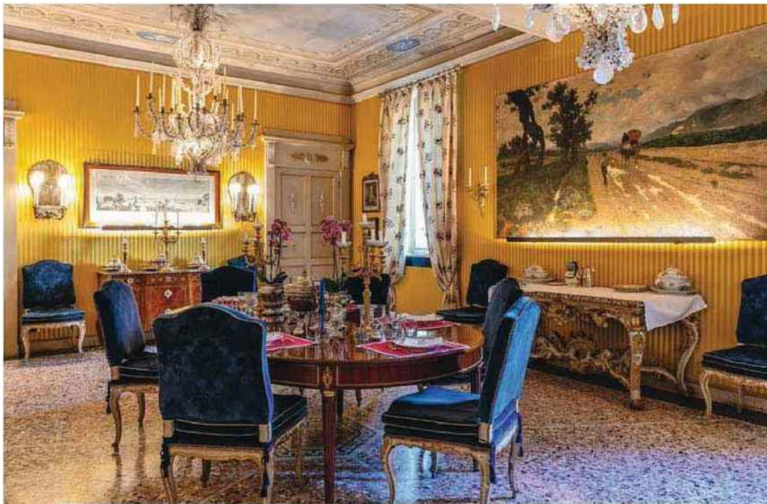
Entre classicisme et touches baroques, stucs floraux et boiseries élégantes, les pièces du mobilier français et italien du XVII e et XVIII e siècle se combinent en harmonie. Ci-dessous, l'une des salles de séjour où se réunit la famille.