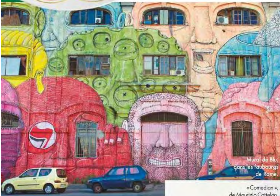
Mural de Blu, dans les faubourgs de Rome.

Une top-modèle très demandée, une marque de luxe parmi les plus désirables (selon l'index Lyst 2019) : Vittoria Ceretti et Bottega Veneta incarnent le cocktail mode le plus explosif des podiums. À retrouver, fin février, à la fashion week de Milan.