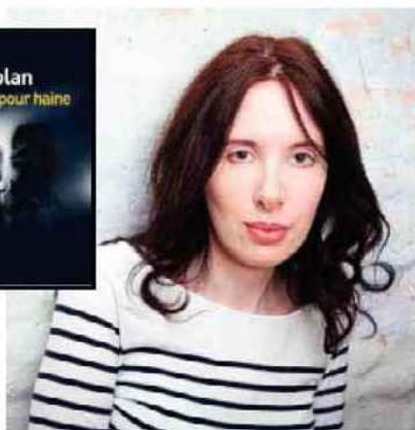
MARK VESSEY/SP - FRANCISCA NANTOIAN/ÉDITIONS GALLIMARD