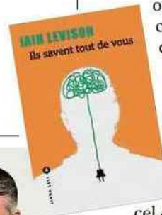
Iain Levison signe un thriller fantastique sur l'encerclement de notre intimité.

une jeune femme, au service d'une agence fédérale plus ou moins occulte, comprend que le condamné en face d'elle a un don identique.